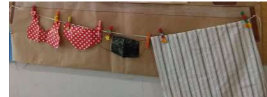
Un estenedor amb roba pròpia d'aquest estiu (mascareta, banyador...)