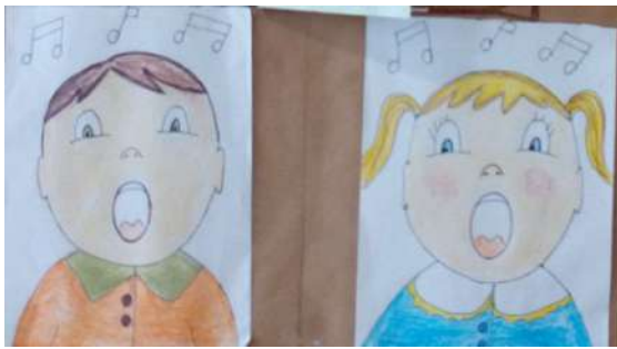
Dibuix de nen i nena cantant

Un cop fet el mural amb la finestra i les banderoles, podem anar elaborant i afegint diferents elements dins i fora la finestra, segons l'enginy de cadascú: