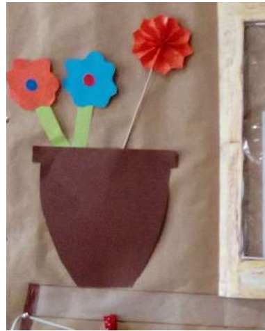
Lleixa amb testos amb flors o ornaments - us podeu inspirar en la 14a manualitat que ja vam fer.